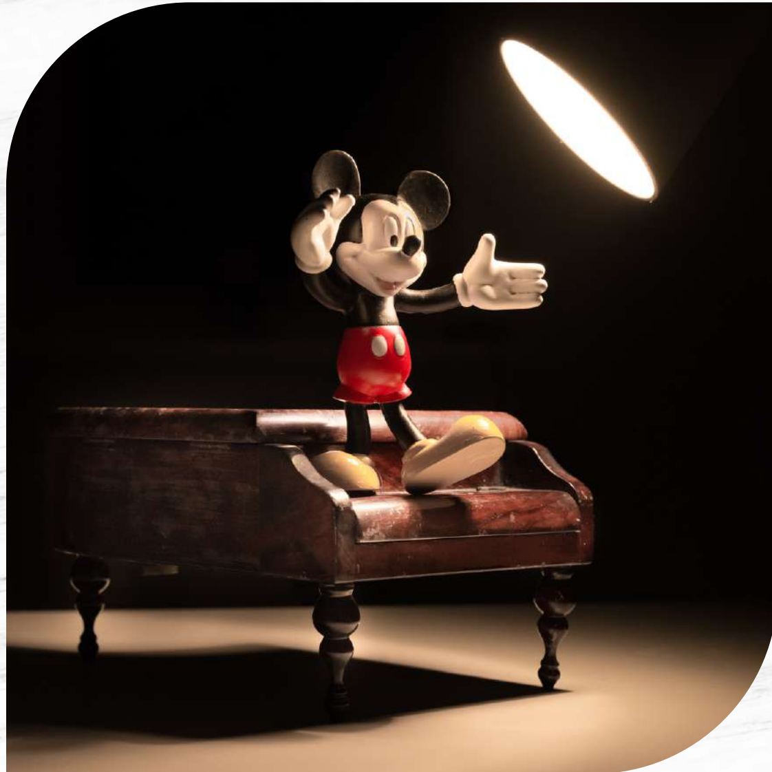
Walt Disney Studios